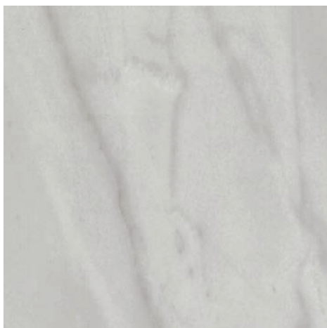
60 x 60 cm (24 x 24) VN.AR.GRY.2424.HN