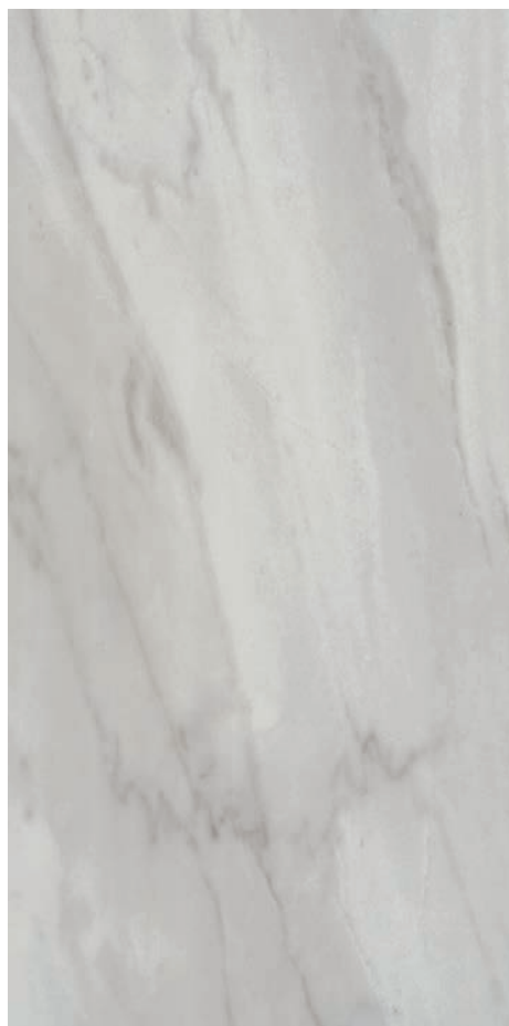
60 x 120 cm (24 x 48) VN.AR.GRY.2448.HN

Tous les items présentés dans ce document font partie du programme d'inventaire Olympia. Pour les commandes spéciales, veuillez contacter votre représentant de Tuiles Olympia.